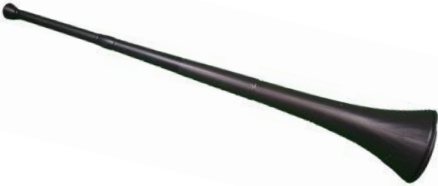
ข้อมูลจาก: https://th.wikipedia.org/wiki/ประเทศแอฟริกาใต้

เครื่องดนตรีพื้นเมืองคือวูซูลา (อังกฤษ: vuvuzela, เป็นภาษาซูลู แปลว่า ทำให้เกิดเสียงดัง) หรือในบางครั้งเรียก เลปาตาตา (Lepatata ในภาษาสวานา) เป็นเครื่องดนตรีประเภทเป่าคล้ายทรัมเป็ต เป็นเครื่องดนตรีและวัฒนธรรมของชนพื้นเมืองแอฟริกาใต้ มีความยาวประมาณ 1 เมตร เสียงของวูซูลา เป็นไปในลักษณะดังกึกก้อง คล้ายเสียงร้องของช้าง และเป็นที่รู้จักไปทั่วโลกจากการแข่งขันฟุตบอลโลก 2010 ที่ใช้เป็นเครื่องดนตรีเป่าเชียร์นักเตะจากประเทศต่างๆ